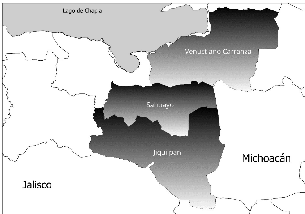
Figura 2. Zona metropolitana emergente Sahuayo-Jiquilpan-Venustiano Carranza